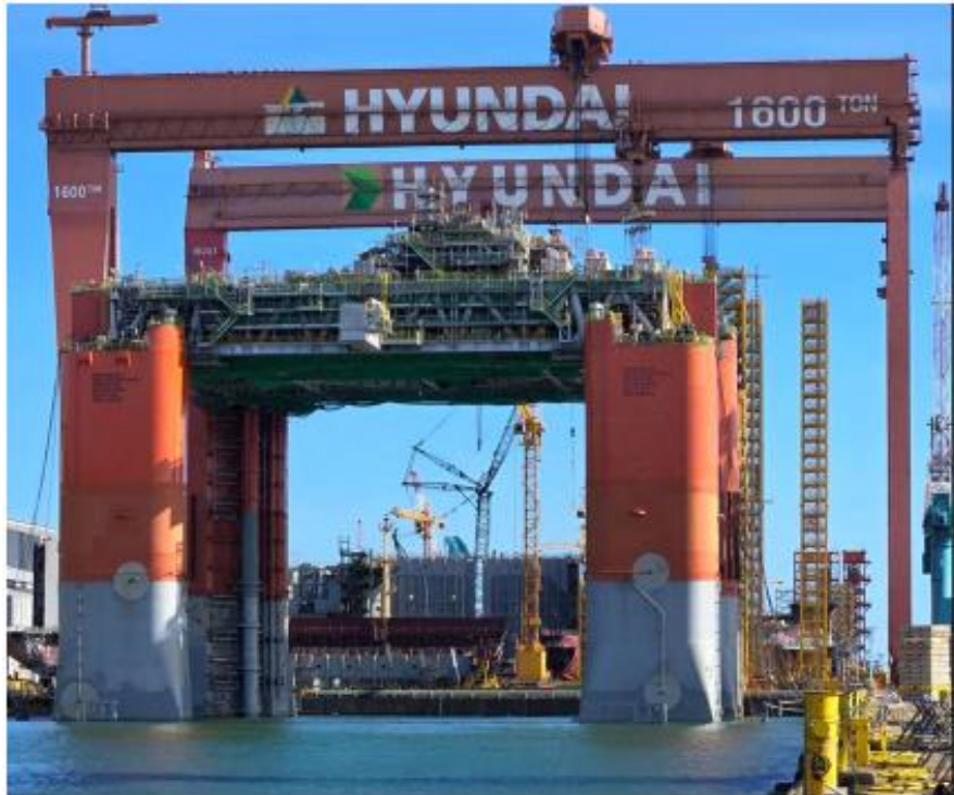
ה-FPS לאחר חיבור החלק העליון (Topsides) לבסיס ה-FPS (Hull) במתקני מספנת HHI

■ מערכות תת-ימיות – מפעילת הפרויקט התקשרה בחודש ינואר 2022 עם חברת Subsea7 בהסכם לתכנון ההנדסי, הרכש, הבנייה וההתקנה (EPCI) של ציוד תת ימי הכולל קווי בקרה והזרקת כימיקלים, מערך צנרת ההפקה בקרקעית הים וצינורות אנכיים לפלטפורמת ההפקה (SURF). Subsea7 היא חברה עתירת ניסיון, ששירותיה נשכרו גם כדי לספק את מכלול ה-SURF לפרויקט 20k אחר במפרץ מקסיקו, ארה"ב. Subsea7 השלימה את עבודות הריתוך של הצנרת במתקן היבשתי שלהם. צנרת זו תותקן על גבי גלגלת באוניית ההתקנה, לצורך שינוע והתקנת הצנרת בקרקעית הים בשדה שננדואה. כמו כן Subsea7 השלימה את עבודות התקנה של היתדות לעגינת ה-FPS לקרקעית הים במיקום העתידי של ה-FPS.