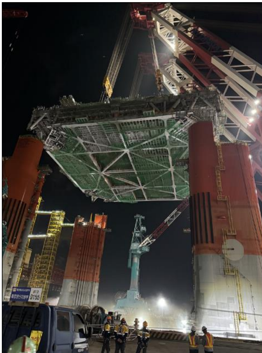
הנפת החלק העליון (Topsides) של מתקן הטיפול וההפקה על גבי בסיס ה-FPS (Hull) במתקני מספנת HHI

מפעילת הפרויקט מעריכה כי העלויות הקשורות בתאונת העבודה, לרבות תיקון ה-Topsides, השטת ה-FPS והתקנתו, יכוסו במסגרת הכיסוי הביטוחי הקיים להקמת הפרויקט ו/או במסגרת ההסכם עם HHI, ועל כן, לא צפויה לכך השפעה מהותית על תקציב הפרויקט.