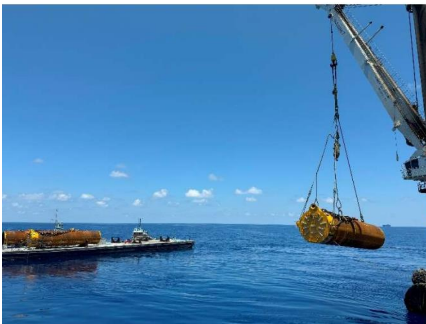
התקנה ימית של אחת מתוך 12 היתדות לעגינת ה-FPS לקרקעית הים

■ מערכות תת-ימיות – מפעילת הפרויקט התקשרה בחודש ינואר 2022 עם חברת Subsea7 בהסכם לתכנון ההנדסי, הרכש, הבנייה וההתקנה (EPCI) של ציוד תת ימי הכולל קווי בקרה והזרקת כימיקלים, מערך צנרת ההפקה בקרקעית הים וצינורות אנכיים לפלטפורמת ההפקה (SURF). Subsea7 היא חברה עתירת ניסיון, ששירותיה נשכרו גם כדי לספק את מכלול ה-SURF לפרויקט 20k אחר במפרץ מקסיקו, ארה"ב. Subsea7 השלימה את עבודות הריתוך של הצנרת במתקן היבשתי שלהם. צנרת זו תותקן על גבי גלגלת באוניית ההתקנה, לצורך שינוע והתקנת הצנרת בקרקעית הים בשדה שננדואה. כמו כן Subsea7 השלימה את עבודות התקנה של היתדות לעגינת ה-FPS לקרקעית הים במיקום העתידי של ה-FPS.