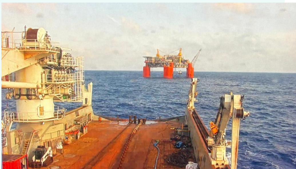
התקנת העוגנים של ה-FPS