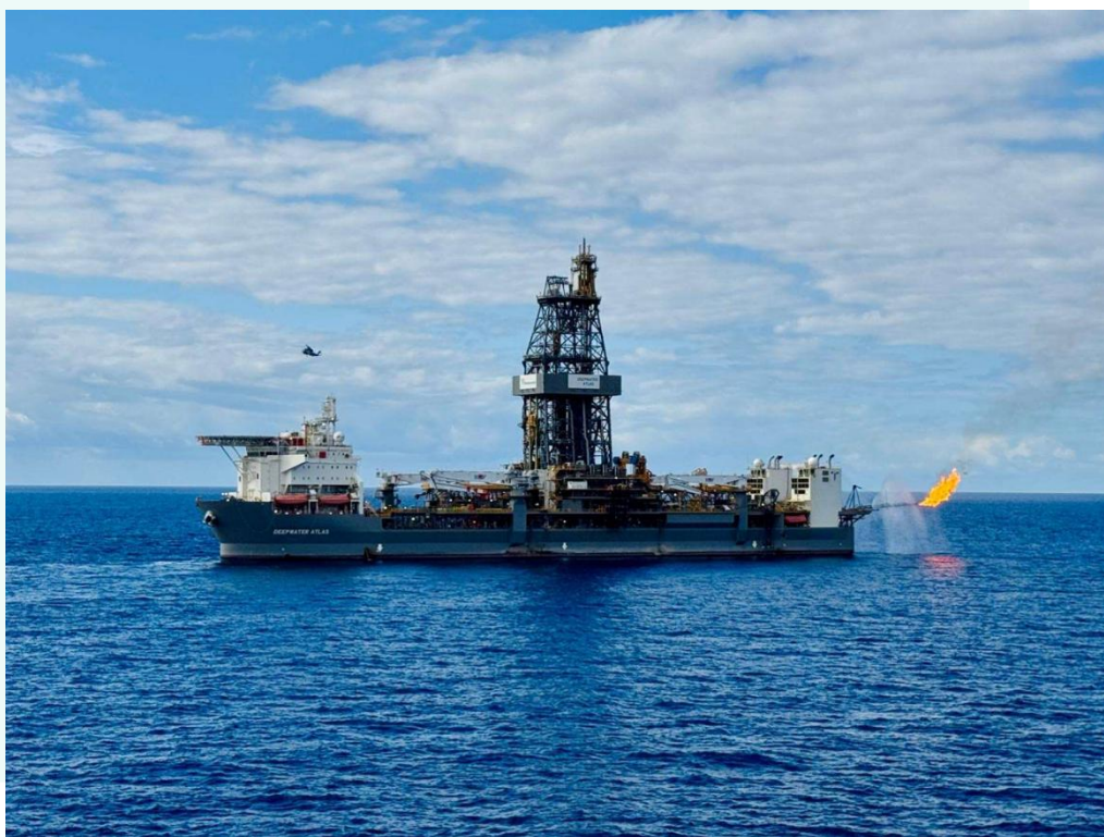
הפקת נפט וגז בפועל במסגרת בדיקות ההזרמה בקידוח SA008

יצוין, כי קיימים כיום מספר פרויקטי offshore במפרץ אמריקה אשר כוללים שימוש בצידוד המותאם ל-20k psi, המופעלים על ידי חברות הנפט מהגדולות בעולם. דוגמאות לפרויקטים מסוג זה 6 הינן: פרויקט Anchor, המופעל על ידי Chevron ובשותפות עם חברת Total-Energies, שהחל בהפקה בחודש אוגוסט 2024; פרויקט Sparta המופעל על ידי חברת Shell ובשותפות עם חברת Equinor, אשר החלטת ההשקעה הסופית (FID) ביחס אליו התקבלה בחודש דצמבר 2023; ופרויקט Kaskida המופעל על ידי חברת BP אשר החלטת ההשקעה הסופית (FID) ביחס אליו התקבלה בחודש יולי 2024. כמו כן, חברת BP הצהירה כי בכוונתה להכריז על החלטת השקעה סופית (FID) בפרויקט Tiber במהלך שנת 2025.