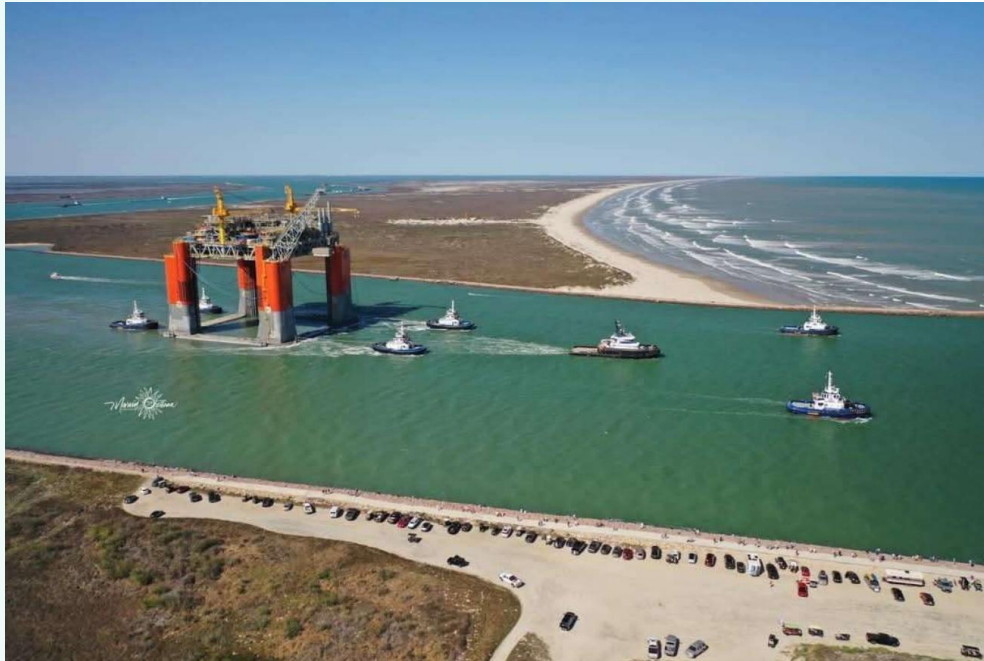
השטת ה-FPS מהנמל בטקסס לשטח מאגר שנדואה

בחודש פברואר, 2025, הגיע מתקן הטיפול וההפקה של הפרויקט למפרץ אמריקה לאחר שהושלמה בנייתו במספנת (HHI) Hyundai Heavy Industries קוריא. בסוף חודש מרץ 2025, הגיע ה-FPS למיקומו הסופי, מעל מאגר שנדואה. למועד זה הסתיימו פעולות עיגונו של ה-FPS לקרקע (באמצעות 12 עוגנים) ועבודות חיבורו לצנרת נמצאות בעיצומן. לאחר שקווי צנרת ייצוא הנפט והגז יחוברו ל-FPS, המפעילה תבצע בדיקות הרצה סופיות של צנרות תהליך הטיפול, ומערכות החשמל והבקרה ב-FPS.