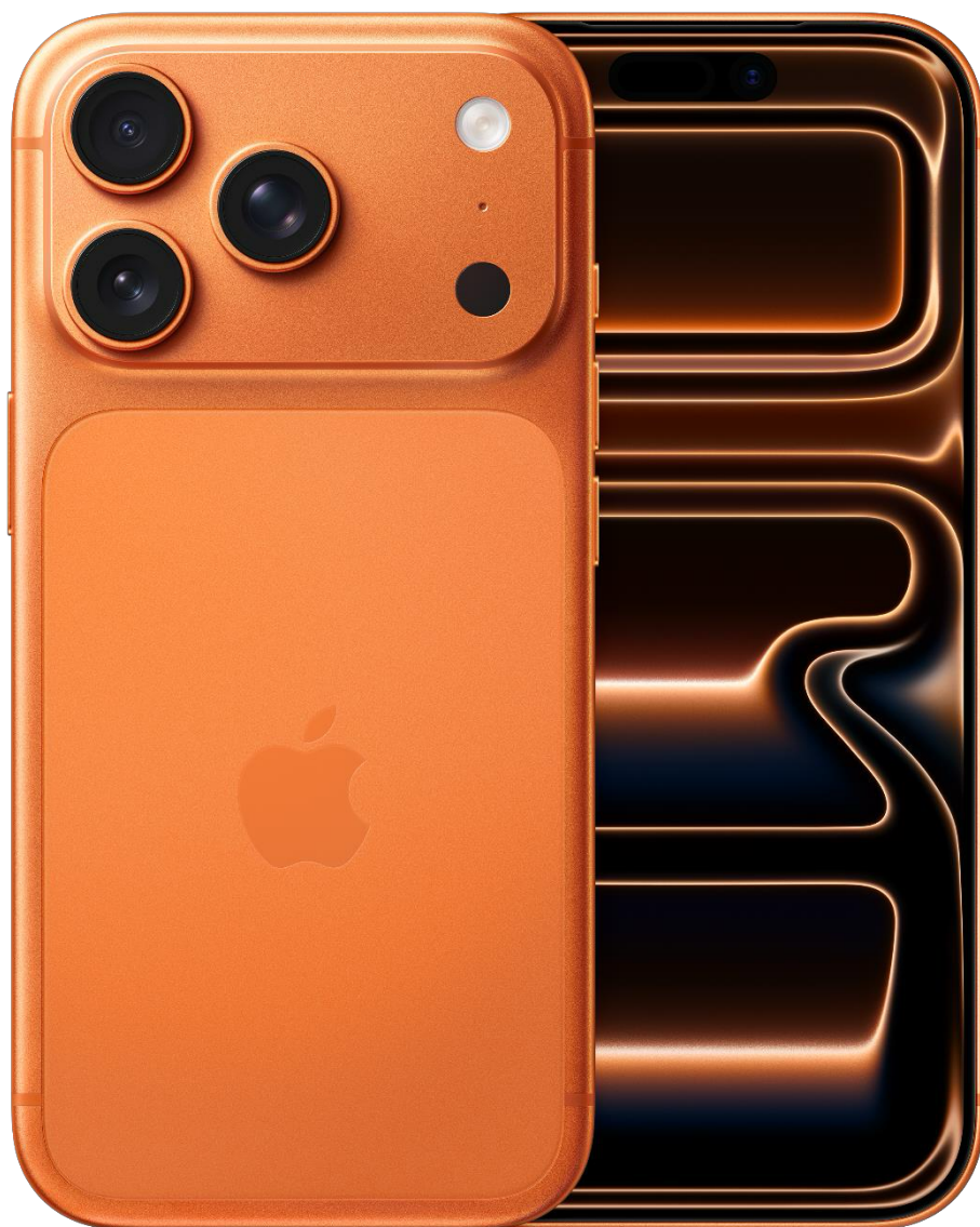
🍏 iPhone 17 Pro