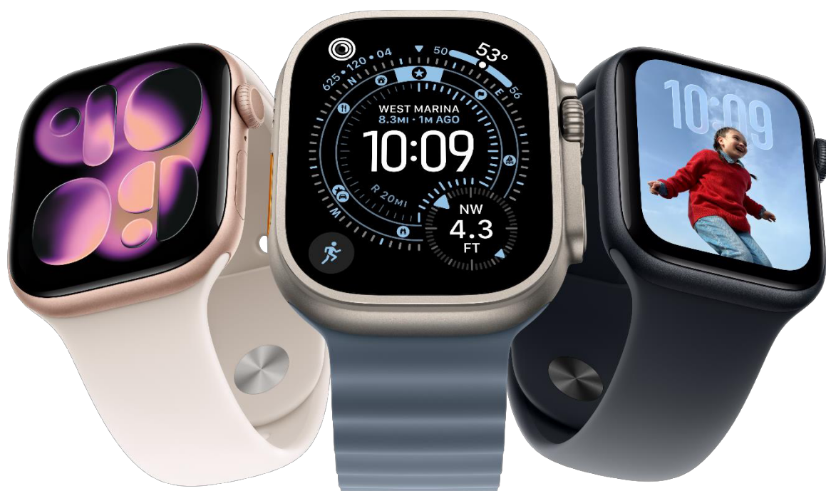
APPLE WATCH SERIES 11