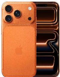
iPhone 17 Pro