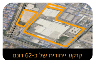
קרעק ייחודית של כ-62 דונם