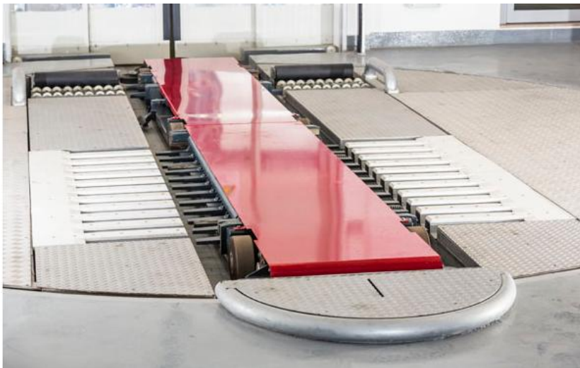
איור 1 - משנע Silomat®

הרכבים מונעים מהכניסה/יציאה על ידי משנע Silomat® המרים את הרכב מהצמיגים באופן בטוח וזאת לאחר מרכזו באופן אוטומטי בציר האורכי בלובי הכניסה.